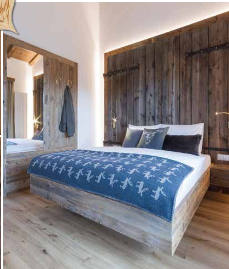
Suite familiari moderne e spaziose fatte in legno di cirmolo, larice, abete rosso e in legno rusticale.