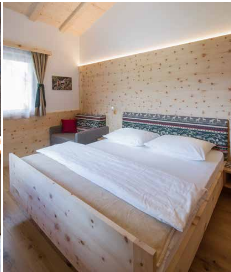
Suite famigliari moderne e spaziose fatte in legno di cirmolo, larice, abete rosso e in legno rusticale.