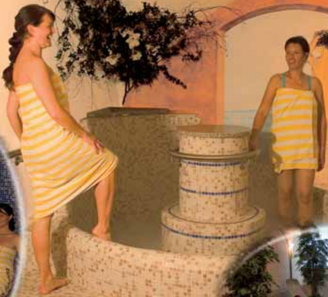
Sauna finlandese, doccia da sogno, sauna vapore, palestra, solarium, vasca Kneipp.