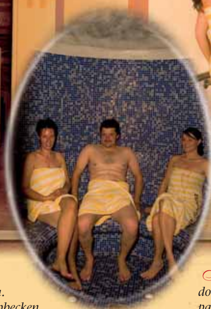
Finnische Sauna, Erlebnisduschen, Dampfsauna. Fitnessraum, Solarium, Kneippbecken.