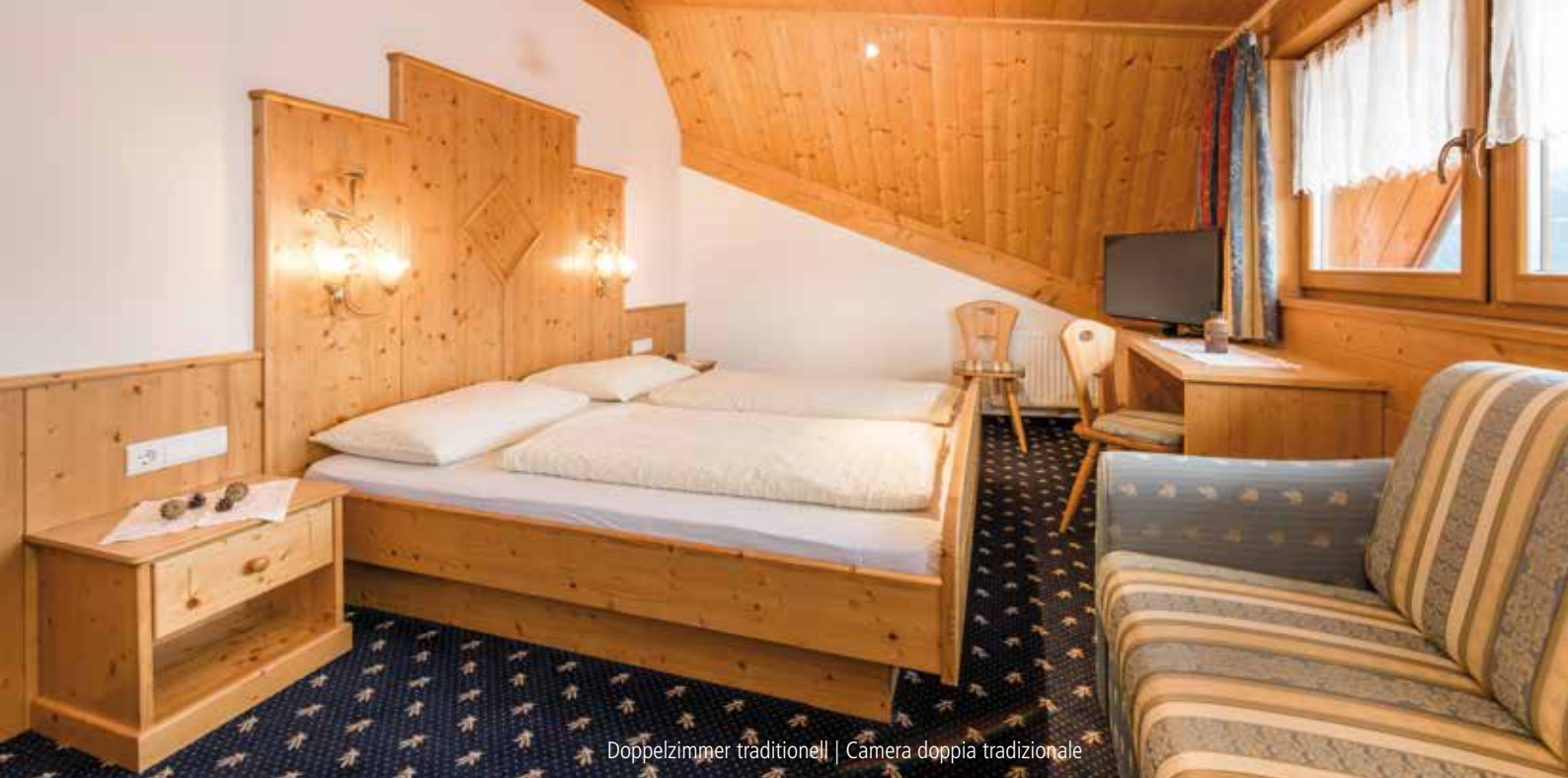
Doppelzimmer traditionell | Camera doppia tradizionale