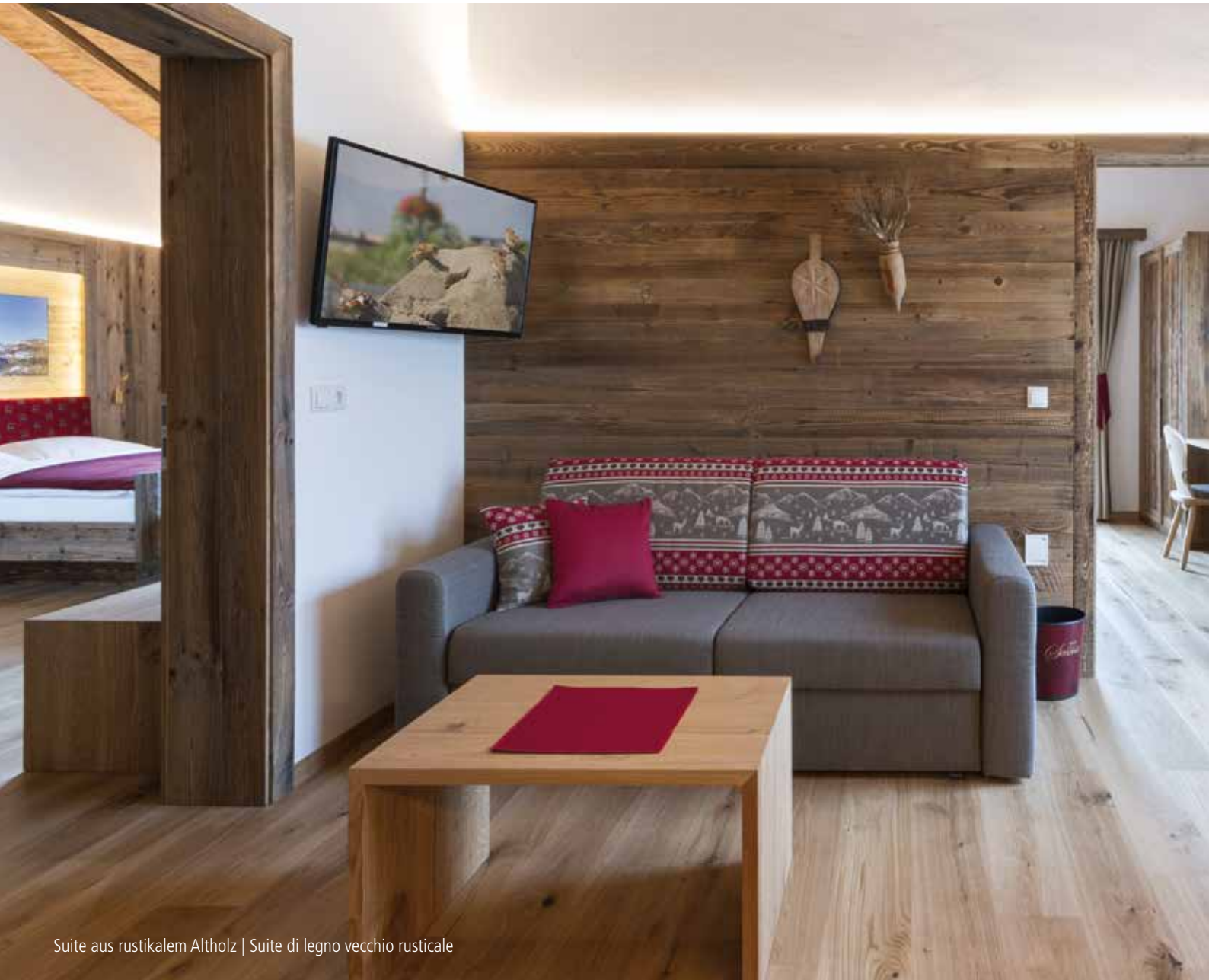
Suite aus rustikalem Altholz | Suite di legno vecchio rusticale