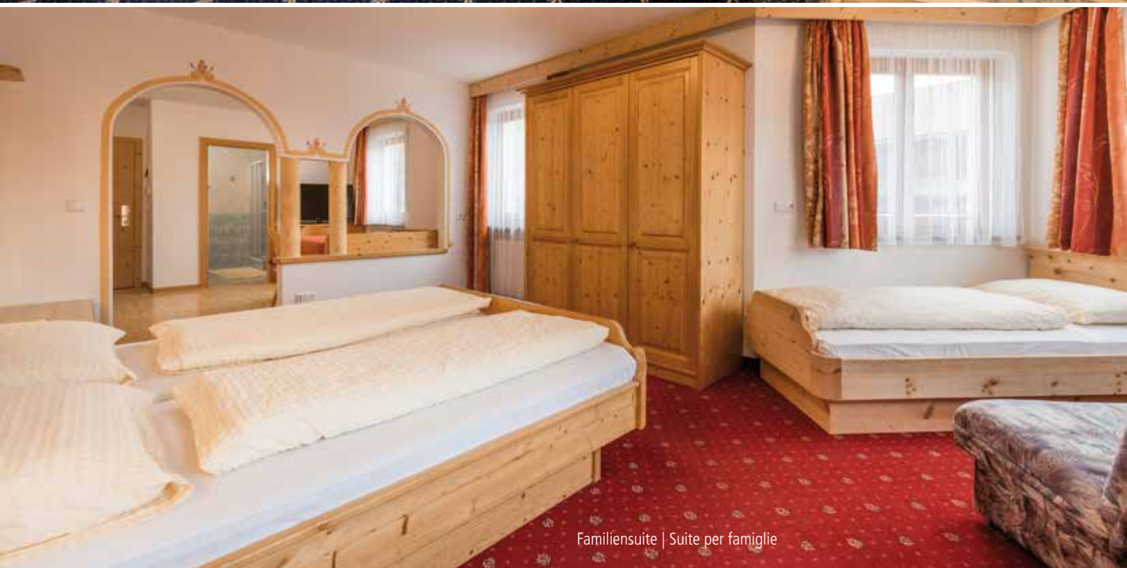
Familiensuite | Suite per famiglie