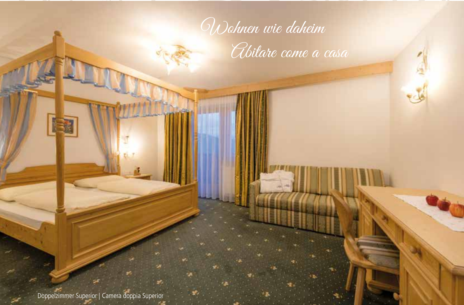
Doppelzimmer Superior | Camera doppia Superior

Unsere Gästezimmer und komfortablen Suiten sind mit Dusche, WC, Fön, Safe, TV und teilweise mit Balkon ausgestattet. Helle und großzügige Räumlichkeiten sorgen für bestes Wohlbefinden.